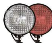
фары на СИМ