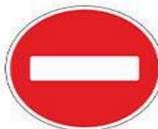
Знак 3.1 «Въезд запрещен»