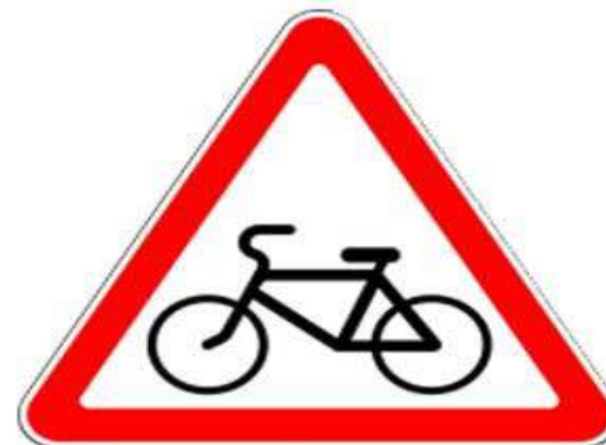
Предупреждающий знак 1.24 «Пересечение с велосипедной дорожкой»