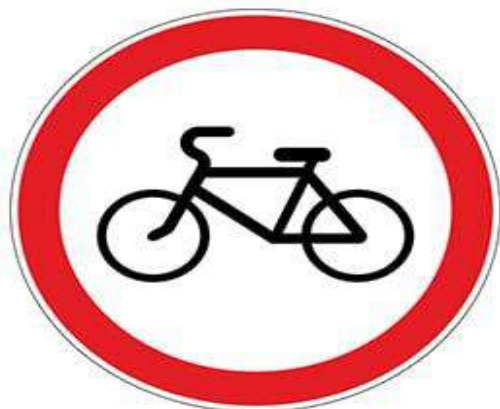
Запрещающий знак 3.9 «Движение на велосипедах запрещено»