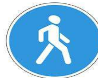
Знак 4.5.1 «Пешеходная дорожка»