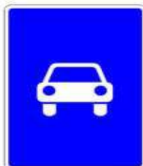
5.3 «Дорога для автомобилей»