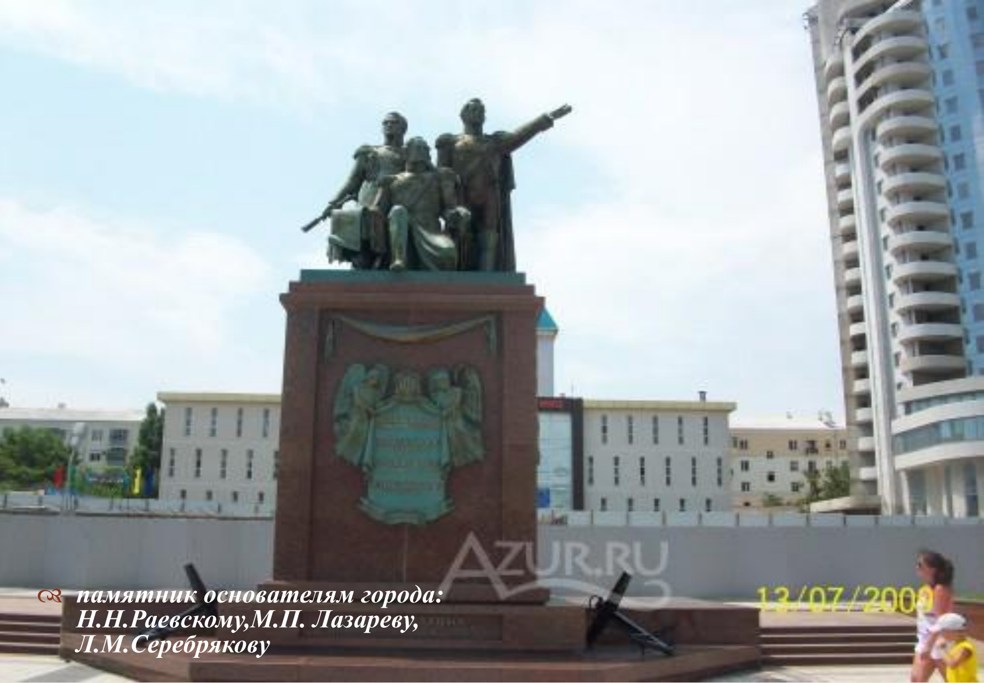
памятник основателям города: Н.Н.Раевскому, М.П. Лазареву, Л.М.Серебрякову