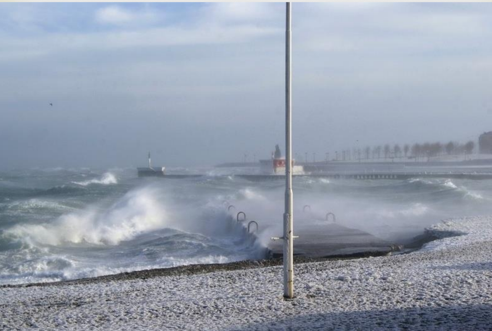
Знаменит город и своим северным ветром- норд остом