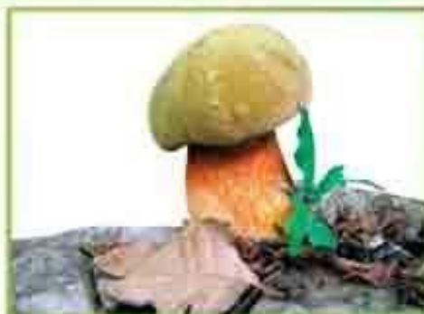
белый гриб (дубовый)