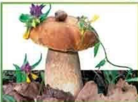
белый гриб (еловый)